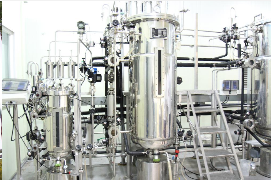
[ 새몸새기운 해독 전문 원외탕전 및 연구소 전경 ]